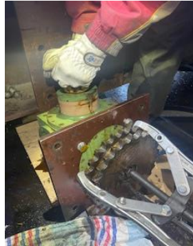
・ウエスト折返し設備ギヤボックスベアリング交換