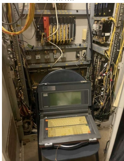
・イースト原動設備シーケンサー盤CPU交換