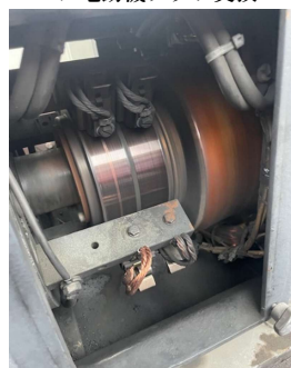
・ペア電動機ブラシ交換