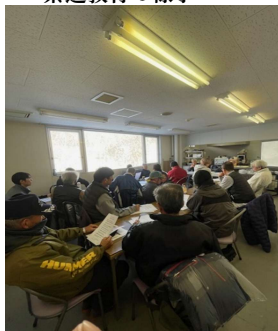
・索道教育の様子