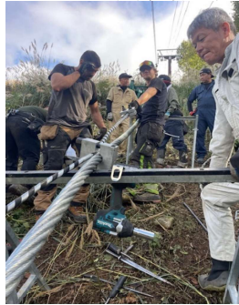
・ウエスト索条更新工事